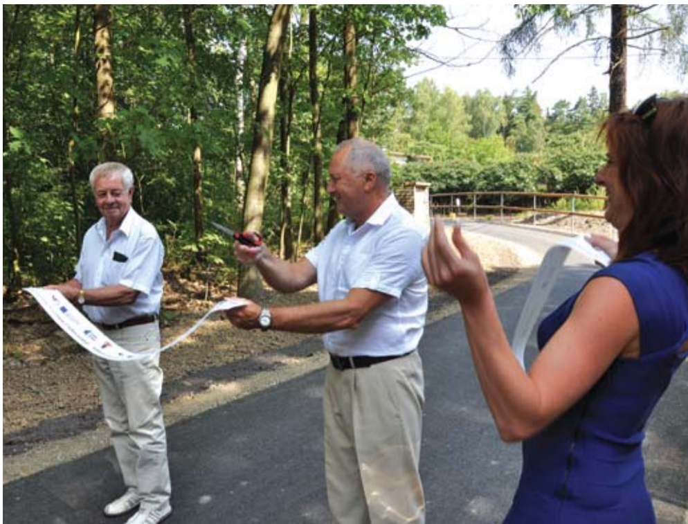
PŘESTŘIŽENO. Cyklostezka z dolu Tuchlovice k nádraží Kamenné Žehrovice je otevřena.

Další čtyři kilometry cyklostezek u středočeských Tuchlovic postavilo v uplynulých měsících středisko inženýrských staveb. Navázalo tak na první, 1134 metrů dlouhou cyklostezku, kterou tam dokončilo v roce 2012. Cyklisté dnes mohou využívat přes deset kilometrů na sebe navazujících tras mezi obcemi Lány a Srby.