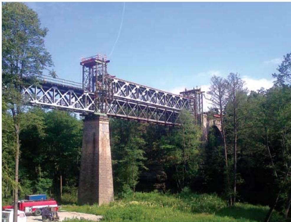
115 LET. Ocelový viadukt s pěti pískovcovými oblouky patří do historie.

Hlavním předmětem prací na mostě, který je ve výšce kolem čtyřadvaceti metrů nad terénem, bylo snesení původního železničního svršku, demontáž středové podlahy, demontáž úhelníků pro stabilitu vagonů a mostnice na staré ocelové konstrukci. Stávající ocelová konstrukce byla odvezena do šrotu. Nahradila ji nová ocelová konstrukce (obr. 1). Následně byla provedena zpětná montáž železničního svršku, nových mostnic, úhelníků a ocelové podlahy. S montáží kolejnic pomohl závod kolejových staveb. „Současně s tím jsme také provedli betonáž