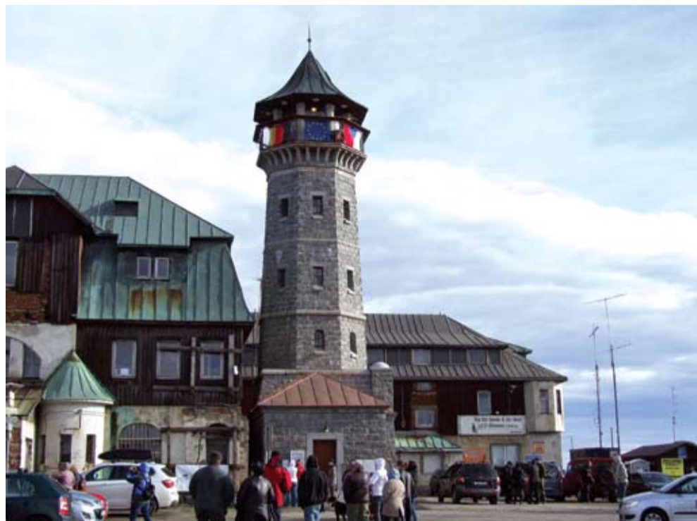
V SOULADU S OKOLÍM. Replika původní osmiboké vyhlídkové věže kopíruje originál.

Přibližně jedenáct set lidí využilo sváteční pondělí 28. října, aby vystoupali na ochoz obnovené rozhledny na Klínovci při jejím slavnostním otevření. Repliku původní věže z roku 1884 postavil závod mostních staveb společnosti Chládek & Tintěra.